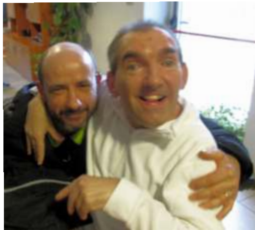
Assieme ad uno dei sette fratelli