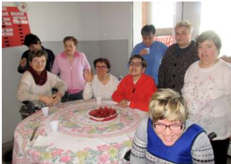
8 marzo, Festa della donna. Il gruppo era reduce dalla precedente festa del 6 gennaio!