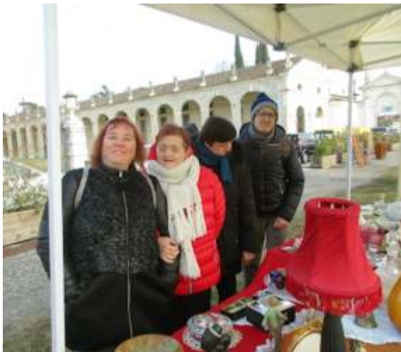
Uscita a un mercatino di Villa Manin

Ho passato bene le feste di Natale. Siamo andati a mangiare al ristorante dove ho mangiato delle cose prelibate che erano molto buone e quando abbiamo finito di mangiare siamo ritornati alla Pannocchia. Alla fine dell'anno siamo andati a cena a mangiare la pizza, l'ho scelta ai quattro formaggi. Prima di cena siamo anche andati al bar per bere l'aperitivo e ci hanno offerto le patatine.