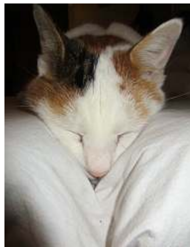
Fuori tema, Focaccina. Bella foto!

A pranzo e a cena ci sono alcune regole da seguire. È normale perché si è in tanti. Per stare meglio e non agitarsi, ci faranno vedere anche dei video per farci degli