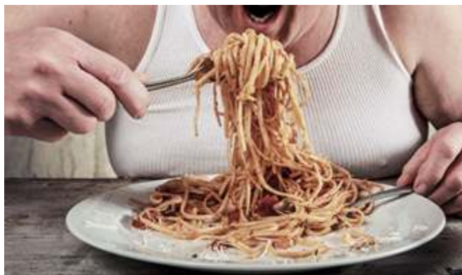
Mangiare correttamente la pasta ...

Inoltre verranno preparati dei cartelloni e le regole verranno scritte 'in positivo' e 'in negativo', ovvero verrà citato il comportamento corretto e il corrispettivo divieto. Un esempio è questo: le posate sporche si poggiano sul tovagliolo o a bordo piatto / le posate sporche non si appoggiano sulla tovaglia.